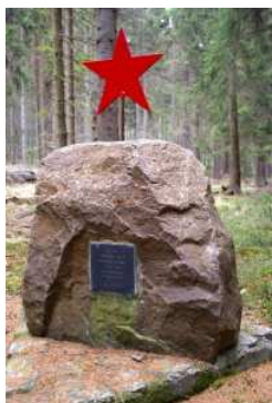
Petrov Pomník neznámého vojáka RA