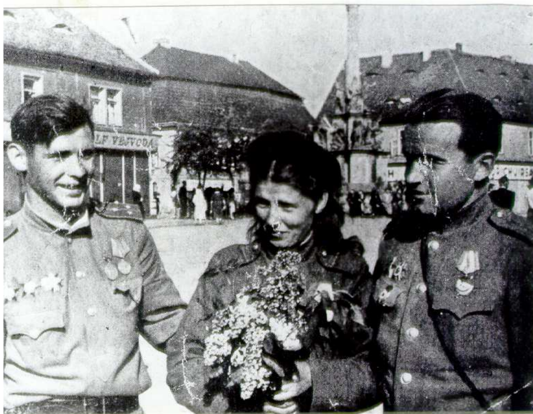
NA PA- MÁTKU Z BORKU A Z ROKY- CAN