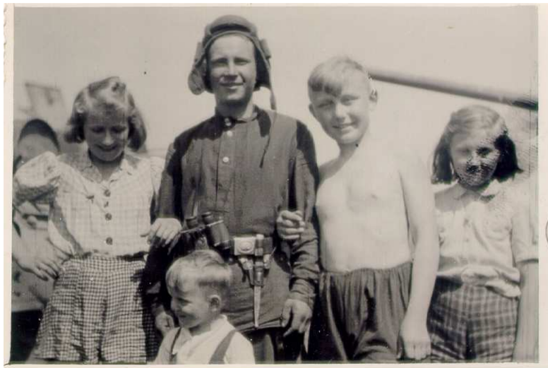
9.5.1945 v pozdních nočních hodi- nách dorazily do rokycan- ského před- městí Borek první prů- zkumné tanky Rudé armády.