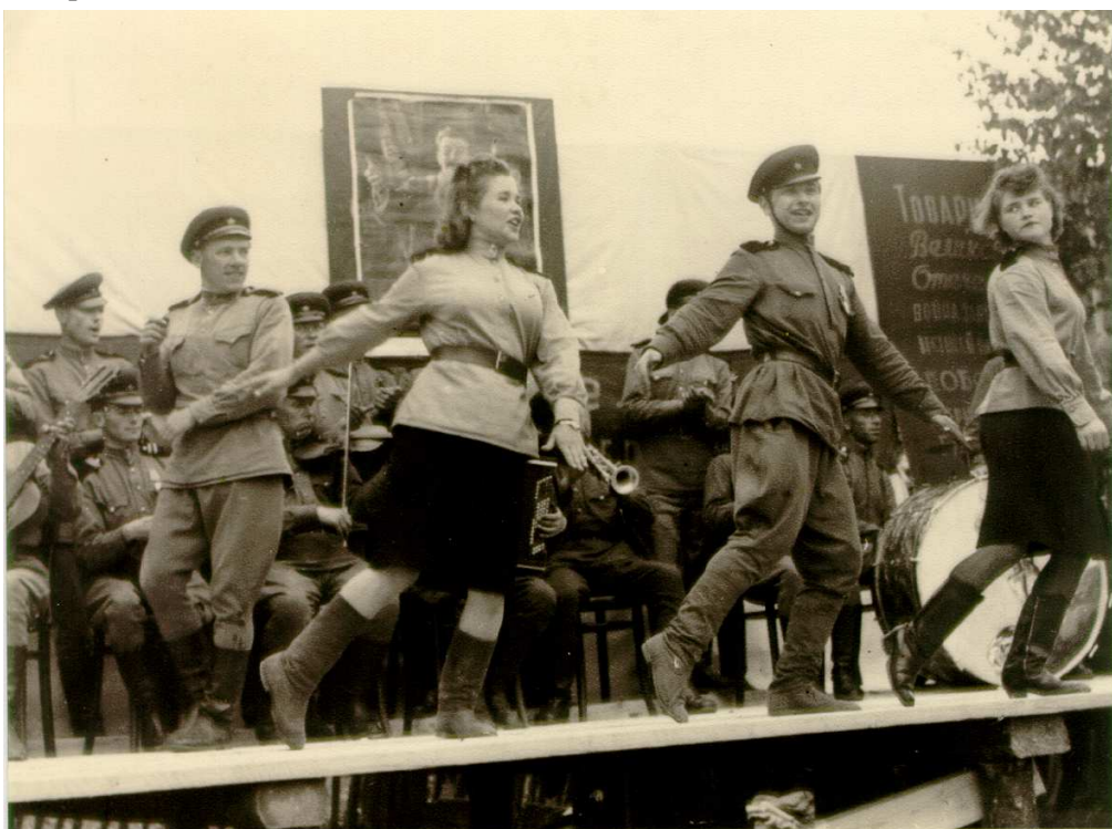
Osvobození 1945: V červnu 1945 vystoupil v Radnicích soubor písní a tanců Rudé armády.

Dnešní globalizace má obrovský náskok před sociální revolucí – a to i díky televizi, rozhlasu a zejména internetu, který je nastaven tak, aby rozmělnil a zneškodnil v zárodku jakékoli podobné hnutí. – Internet vedle dalších moderních propagandistických médií se stal skutečnou zbraní kontrarevoluce a vojenské agrese na planetě Zemi těmi mocnými. (Cis)