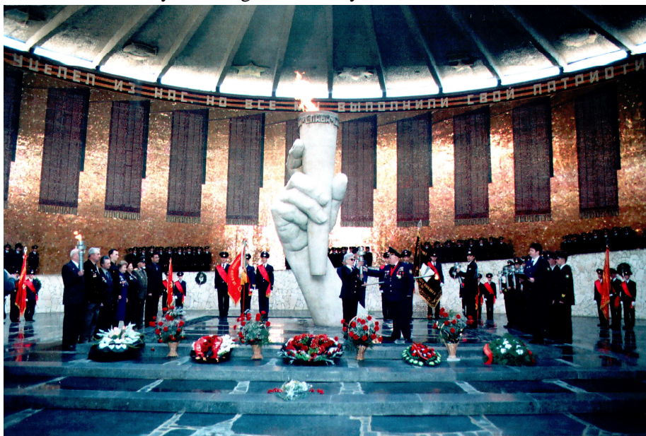
Předávání Pochodně Vítězství města Volgogradu

Z města Rokycan byly schválené dvě delegátky, které se měly zúčastnit oslav vítězství bitvy u Stalingradu, konaných ve dnech 11. – 13. dubna 2005.