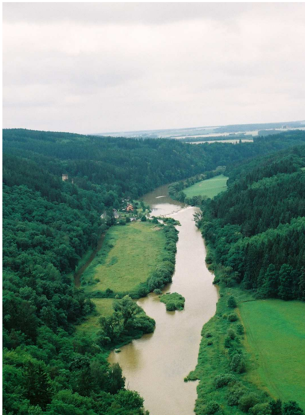
Pohled na Berounku z liblínské vyhlídky