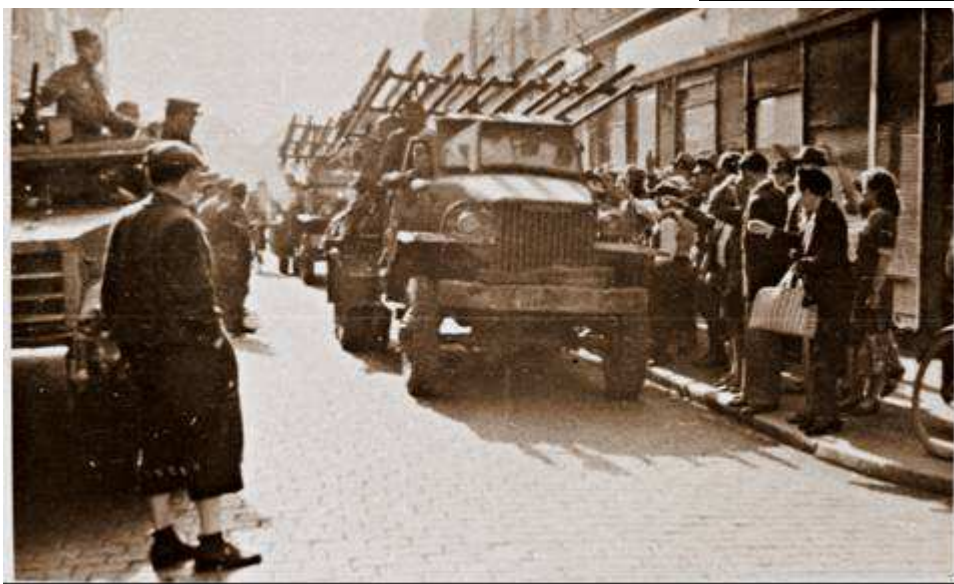
Kat'uška v bojích u Stalingradu – a v Rokycanech Ze Stalingradu do Berlína, z Berlína do Prahy a do Rokycan – to byla cesta „Kat'uší“ na přehlídce Rudé armády v Rokycanech 21. května 1945