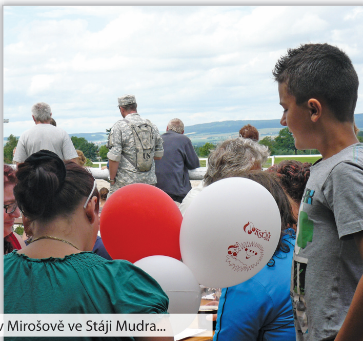
momentky z Dětského dne v Mirošově ve Stáji Mudra...